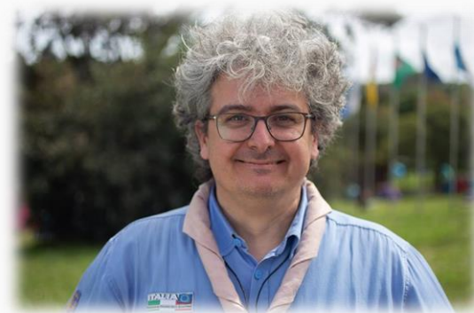
Fabrizio Cocchetti: al ruolo di Capo Scout d'Italia